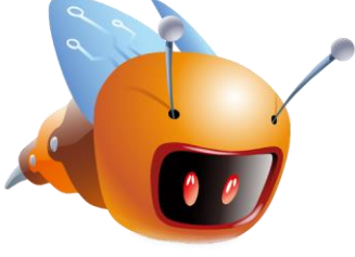
Şekil 3. İTÜRO arı logosu